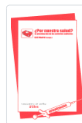
¿POR NUESTRA SALUD? CAS MADRID