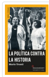
LA POLÍTICA CONTRA LA HISTORIA MARIO TRONTI