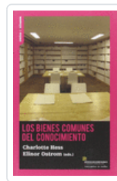
LOS BIENES COMUNES DEL CONOCIMIENTO OSTROM, ELINOR; HESS, CHARLOTTE [eds.]