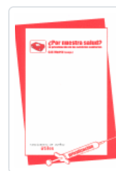
¿POR NUESTRA SALUD? CAS MADRID