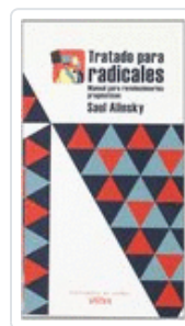
TRATADO PARA RADICALES ALINSKY, SAUL