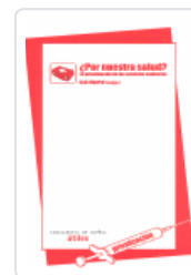
¿POR NUESTRA SALUD? CAS MADRID