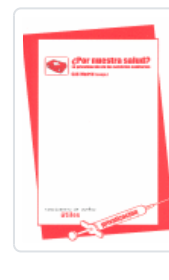
¿POR NUESTRA SALUD? CAS MADRID