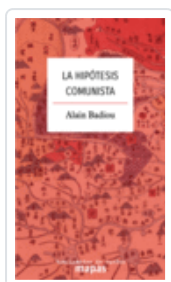
LA HIPÓTESIS COMUNISTA BADIOU, ALAIN