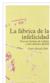
LA FÁBRICA DE LA INFELICIDAD BERARDI, FRANCO