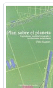
PLAN SOBRE EL PLANETA GUATTARI, FELIX