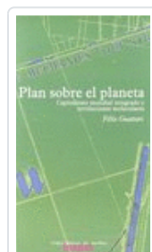
PLAN SOBRE EL PLANETA GUATTARI, FELIX