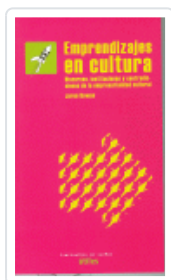
EMPRENDIZAJES EN CULTURA ROWAN, JARON