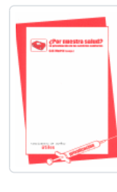
¿POR NUESTRA SALUD? CAS MADRID