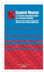
SPANISH NEOCON OBSERVATORIO METROPOLITANO