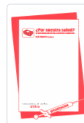
¿POR NUESTRA SALUD? CAS MADRID