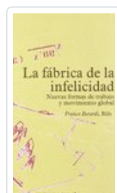
LA FÁBRICA DE LA INFELICIDAD BERARDI, FRANCO