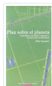
PLAN SOBRE EL PLANETA GUATTARI, FELIX