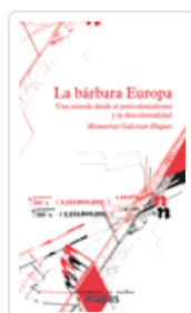
LA BÁRBARA EUROPA GALCERÁN, MONTSERRAT