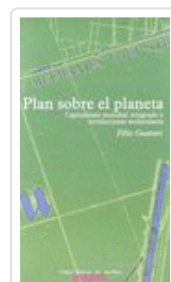
PLAN SOBRE EL PLANETA GUATTARI, FELIX