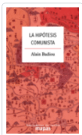
LA HIPÓTESIS COMUNISTA BADIOU, ALAIN