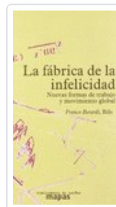
LA FÁBRICA DE LA INFELICIDAD BERARDI, FRANCO