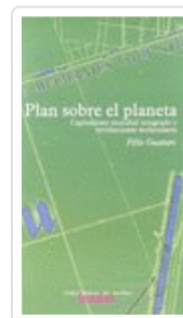
PLAN SOBRE EL PLANETA GUATTARI, FELIX