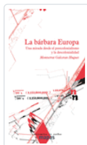
LA BÁRBARA EUROPA GALCERÁN, MONTSERRAT