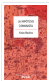
LA HIPÓTESIS COMUNISTA BADIOU, ALAIN