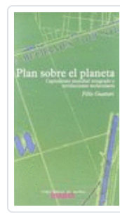
PLAN SOBRE EL PLANETA GUATTARI, FELIX