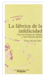
LA FÁBRICA DE LA INFELICIDAD BERARDI, FRANCO