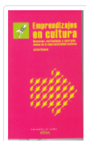
EMPRENDIZAJES EN CULTURA ROWAN, JARON