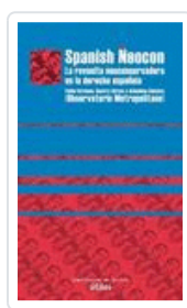
SPANISH NEOCON OBSERVATORIO METROPOLITANO