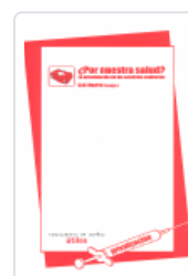
¿POR NUESTRA SALUD? CAS MADRID