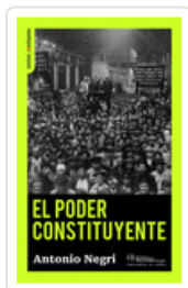
EL PODER CONSTITUYENTE NEGRI, ANTONIO