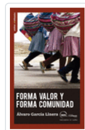
FORMA VALOR Y FORMA COMUNIDAD GARCÍA LINERA, ALVARO