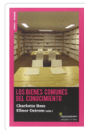
LOS BIENES COMUNES DEL CONOCIMIENTO OSTROM, ELINOR; HESS, CHARLOTTE [eds.]