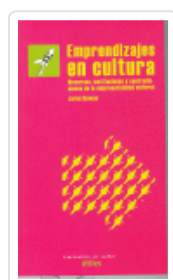
EMPRENDAJES EN CULTURA ROWAN, JARON