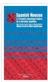
SPANISH NEOCON OBSERVATORIO METROPOLITANO