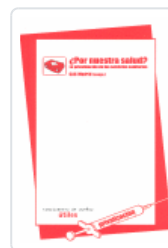
¿POR NUESTRA SALUD? CAS MADRID