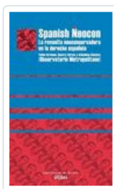
SPANISH NEOCON OBSERVATORIO METROPOLITANO