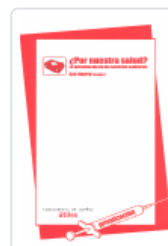
¿POR NUESTRA SALUD? CAS MADRID