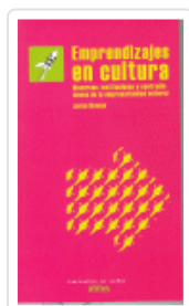
EMPREDIZAJES EN CULTURA ROWAN, JARÓN