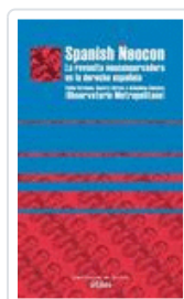
SPANISH NEOCON OBSERVATORIO METROPOLITANO