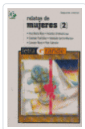
RELATOS DE MUJERES (2) MOIX