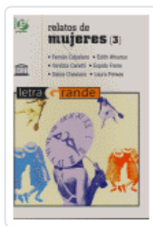
RELATOS DE MUJERES (3) CABALLERO FERNAN;WHARTON EDITH